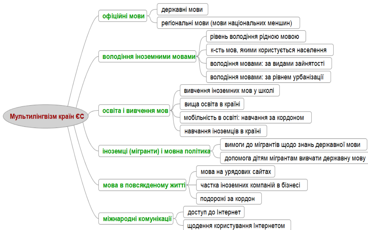
Рис. 1. Система індексів мультилінгвізму

Для реалізації дослідницьких завдань побудовано систему узагальнюючих індексів, як одного з найбільш популярних підходів до ранжування країн у випадку складних і багатокритеріальних ситуацій. За основу беруться наявні статистична база й експертні оцінки (Рис. 1).