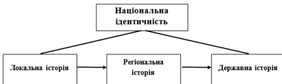
Рис. 2 Модель зв'язку історії і національної ідентичності

Однак слід пам'ятати, що національна ідентичність – надзвичайно складне явище, і ця стаття стосується лише аспекту історії, а точніше – аспекту історичної пам'яті. Врахування окремих рівнів – місцевого, регіонального та національного – дозволить створити вичерпну картину історичної пам'яті країни загалом з урахуванням її складності та багатозначності 19 . Важливо підкреслити, що вивчення історії, а точніше історичної істини, вимагає проведення якісних і ретельних наукових досліджень із врахуванням аспектів історії, традиції чи культури українського народу. Радує, що такий тип досліджень стає дедалі частішою практикою в сучасній українській науці.