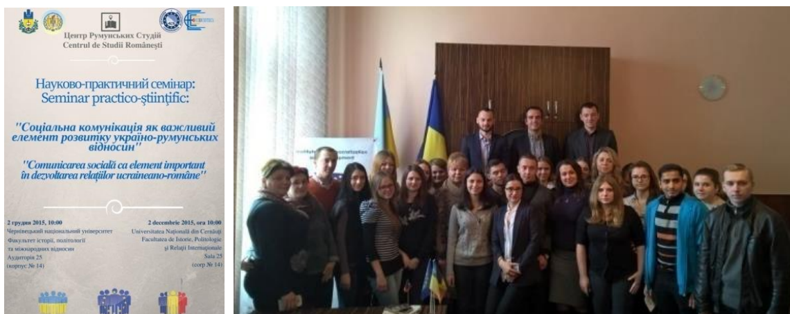
Науково-практичний семінар «Соціальні комунікації як важливий елемент розвитку сучасних україно-румунських відносин», 2015 р.

2 квітня 2016 року вперше в Центрі румунських студій відбувся меморіальний захід «День вшанування пам'яті жертв трагічних подій 1941 року в Білій Криниці». Організаторами заходу стали Центр румунських студій, Генеральне консульство Румунії в Чернівцях, Інститут демократизації та розвитку, а також Асоціація «Європейські Конвергенції» (м. Бухарест).