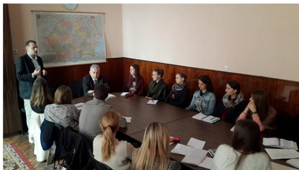
Підписання меморандуму про співпрацю, 2016 р.

У роботі конференції прийняли участь студенти вищих навчальних закладів України та Румунії. Почесними гостями заходу стали Генеральний консул Румунії в м. Чернівці Елеонора Молдован, заступник декана факультету філософії і соціально-політичних наук Яського університету імені А.І. Кузи (Румунія), віце-президент Асоціації Румунії з міжнародних відносин та європейських студій проф. Дж.Поєде, голова Асоціації Європейської конвергенції, один з важливих партнерів Центру румунських студій, Серджиу Дан (Бухарест), а також представник Спеціальної моніторингової місії ОБСЄ в Україні Гюнтер Гугенбергер. Основними тематичними напрямками роботи конференції були: румунський досвід європейської інтеграції для України; соціально-економічний аспект двохсторонніх відносин; Румунія в євро-