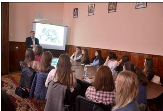
Відкрита лекція Доріна Долгі, 2015 р.