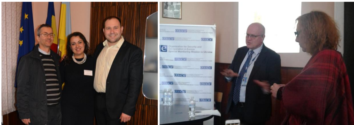
Спільні заходи з Спеціальною моніторинговою місією ОБСЄ в Україні.

місією ОБСЄ в Україні. Представники ОБСЄ постійно відвідують заходи організовані ЦРС, а також презентують їхню діяльність. Реалізовано кілька успішних спільних проєктів.