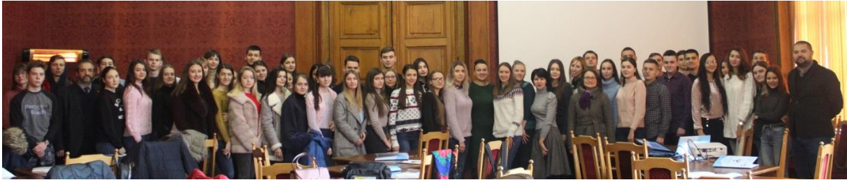
IV міжнародна студентська науково-практична конференція румунознавців “Європейський контекст україно-румунських відносин”, 2018 р.

8 грудня 2017 р. та 30 листопада 2018 р. відбулися III та IV міжнародна студентська науково-практична конференція румунознавців “Європейський контекст україно-румунських відносин”.