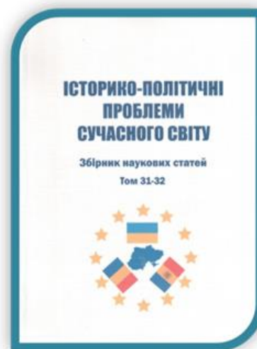
Випуск збірника наукових статей присвячений відкриттю Центру румунських студій

У роботі конференції прийняли участь провідні та молоді науковці вищих навчальних закладів, науково-дослідних інститутів та неурядових організацій з України, Румунії, Республіки Молдова та Нідерландів. Основні тематичні напрями роботи конференції: Російсько-українська війна та безпека (небезпека) в світі; Актуальні регіональні проблеми сучасності: аналіз, прогнозування регіональних явищ та процесів; Інформаційний вимір російсько-української війни; Лінгвокультура та переклад як міст до комунікації з партнерами України в умовах російсько-української війни.