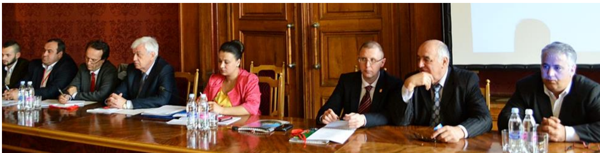
І Міжнародна науково-практична конференція «Сучасні тенденції регіональної співпраці: україно-румуно-молдовський вимір», травень 2015 року.