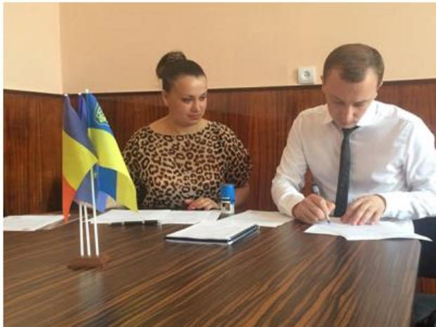
Підписання угоди про співпрацю між ЦРС та Асоціацією «Європейські Конвергенції»

Конференція набувала особливої актуальності, адже глобальна регіоналізація стала найважливішою проблемою сучасної епохи, вона безпосередньо пов'язана з процесами універсально-загальних форм суспільного відтворення і розвитку міжнародних процесів. Все різноманіття виникаючих глобальних проблем інтегрується на регіональному рівні враховуючи особливості регіону. Формат конференції набув нової форми та став майданчиком створення в регіоні своєрідної групи толерантності, співдружності та взаємопідтримки, адже протягом двох останніх років повномасштабного вторгнення росії в Україні ми відчули реальну протекцію сусідніх держав, їх уряди ухвалили ряд спеціальних законів про допомогу громадянам України, згідно з якими українці отримали безпрецедентну масштабну підтримку.