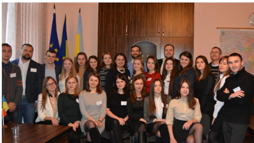
II міжнародна студентська науково-практична конференція "Європейський контекст україно-румунських відносин", 2016 р.