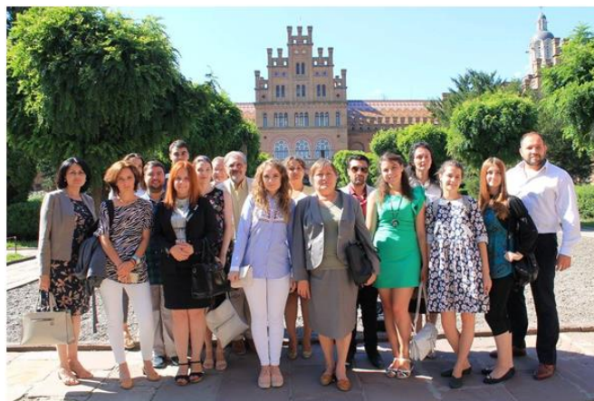
Учасники Літньої міжнародної школи «ГеоПолітика» на тему: «Румунія – Україна – Молдова: дипломатія, стратегія безпеки, конкурентоспроможність, партнерство» в Резиденції митрополитів Буковини і Далмації, 2017 р.

Відповідно до програми літньої школи, учасники слухали та обговорювали доповіді професорів з Румунії, Молдови та України. Викладачі та слухачі літньої