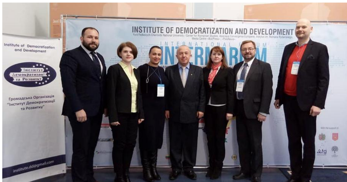
Міжнародний форум «Міжмор'я» - від інформаційного проекту до цивілізаційної реальності