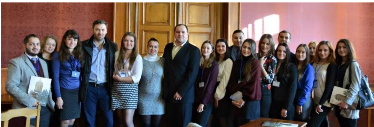
I міжнародна студентська науково-практична конференція румунознавців «Європейський контекст україно-румунських відносин», 2015 р.

8 грудня 2015 року відбулася I міжнародна студентська науково-практична конференція румунознавців «Європейський контекст україно-румунських відносин». У конференції прийняли участь студенти з України та Румунії. Основними тематичними напрямками роботи конференції були: румунський досвід європейської інтеграції для України; соціально-економічний аспект двосторонніх відносин; Румунія в європейському просторі; Україна та Румунія: партнери чи конкуренти?