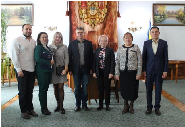
Підписання рамкової угоди про співпрацю між Чернівецьким національним університетом імені Юрія Федьковича та Інститутом Міжнародних відносин Молдови, 2019 р.