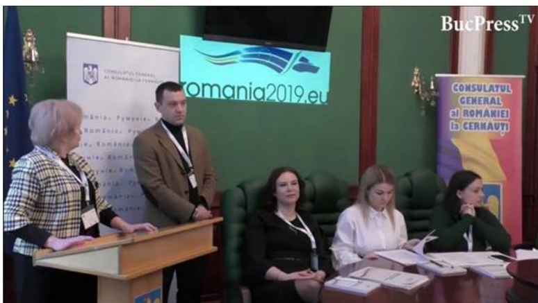
Міжнародна науково-практична конференція «Європейський Союз: сучасність і майбутнє», 2019 р.

2019 рік був роком головування Румунії в Раді ЄС. У зв'язку з цією визначною подією 22 березня 2019 р. відбулася міжнародна науково-практична конференція «Європейський Союз: сучасність і майбутнє». Конференція проводилася під патронатом Генерального консульства Румунії у Чернівцях у співпраці з Чернівецьким національним університет імені Юрія Федьковича, Центром румунських студій, Медіа Центром БукПрес, Лекторатом румунської мови та