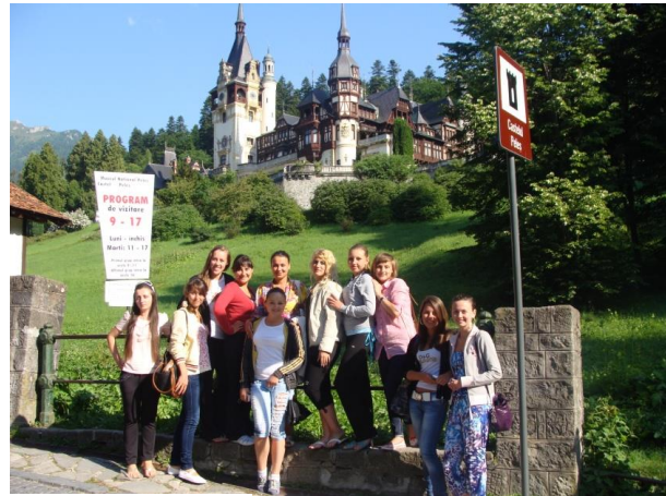
Літня школа мови та культури

Висновки. Останніми роками актуальним питаннями для дослідників та політиків є можливість та потенційні вигоди від реалізації транскордонної співпраці. Особлива увага приділяється врахуванню інтересів спільнот, що проживають у прикордонних регіонах України та Румунії. Інструменти та механізми транскордонного співробітництва в контексті європейської інтеграції України потребують постійного перезавантаження та оновлення.