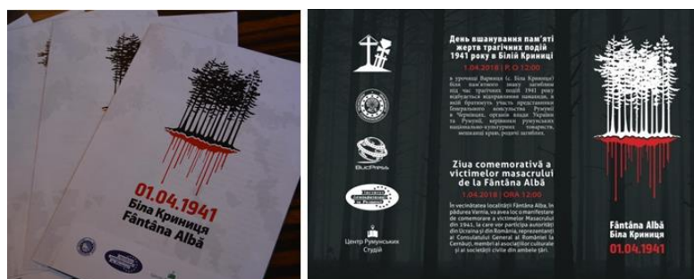
Інформаційні листівки «День вшанування пам'яті жертв трагічних подій 1941 року в Білій Криниці» 2017 р. та 2018 р.