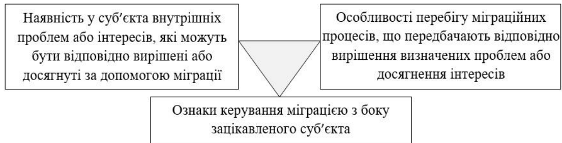
Схема 1. Виявлення можливості використання суб'єктом зовнішньої політики міграції для вирішення внутрішніх проблем

Якщо наявність внутрішніх проблем можна визначити зробивши аналіз політичного і соціально-економічного становища країн регіону, а наявність зовнішньополітичних інтересів – на основі аналізу зовнішньої політики суб'єктів, їх міжнародних і двосторонніх відносин, то в якості основних показників, які б давали нам можливість проаналізувати відповідність характеристик міграції вирішенню вищевказаних проблем і ознаки впливу зацікавленого актора на міграційні процеси, можна використати зокрема: